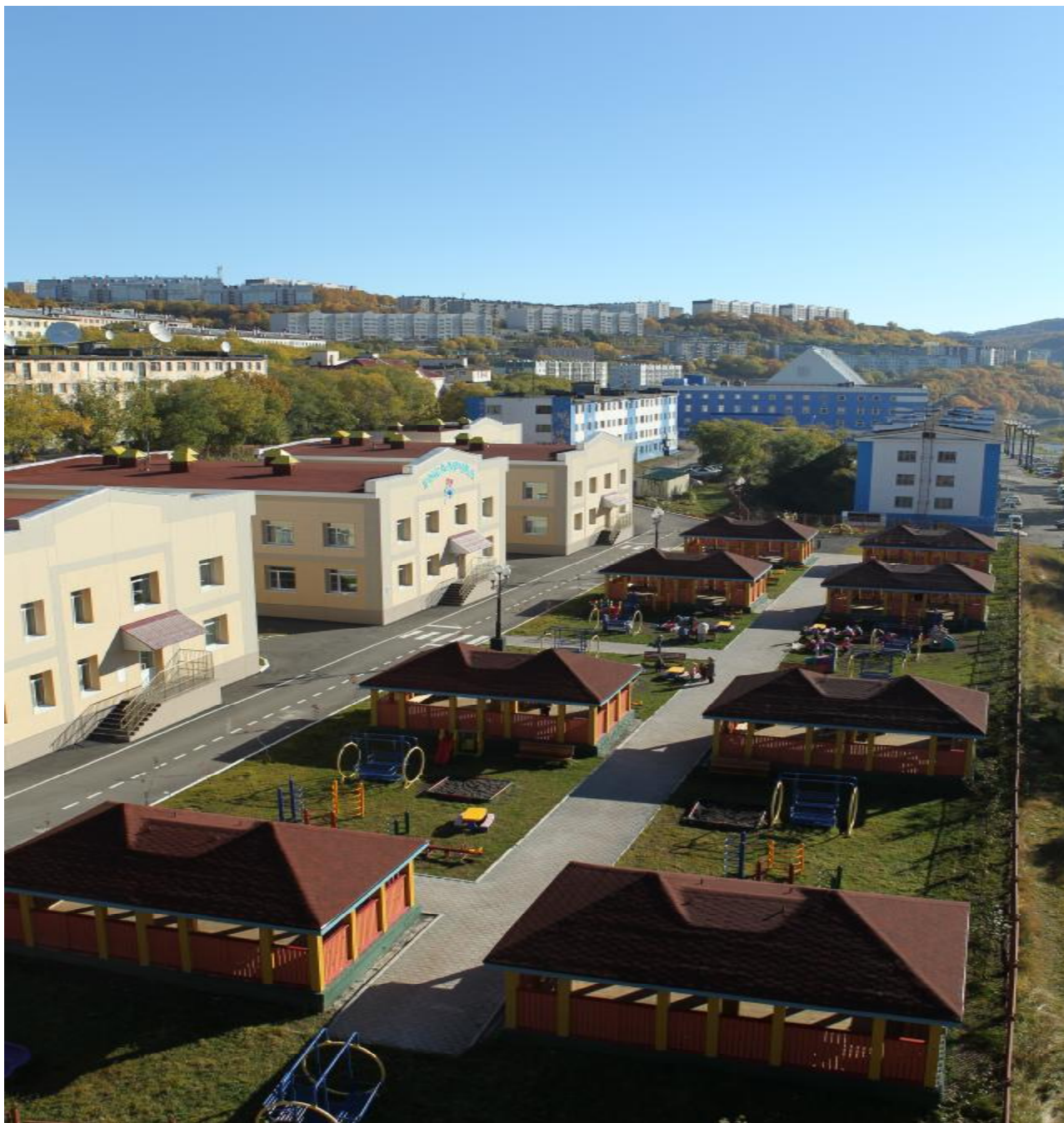
Фотография микрорайона и расположения разметки МБДОУ «Детский сад № 7»